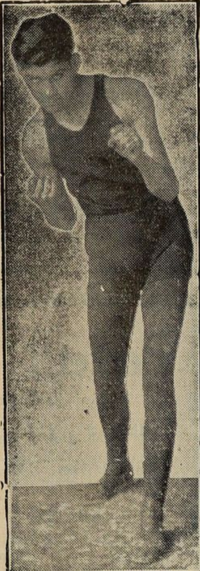
To Seek Glory and Fortune