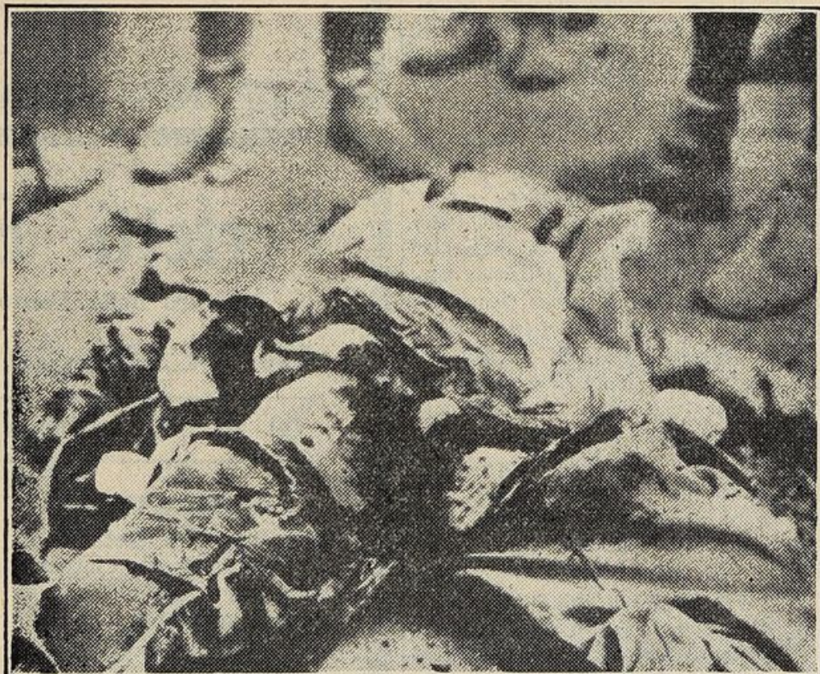
Fotografia di un soldato italiano orrendamente mutilato dagli abissini nella battaglia di Tembien. Altri 25 dei nostri subirono la stessa sorte. Numerose altre fotografie del genere non sono pubblicabili per rispetto alla decenza.

Benone! Il governo francese ha proibito a Rene Drouillet di entrare nel suo aeroplano per andare in Abissinia. L'aeroplano faceva parte di un