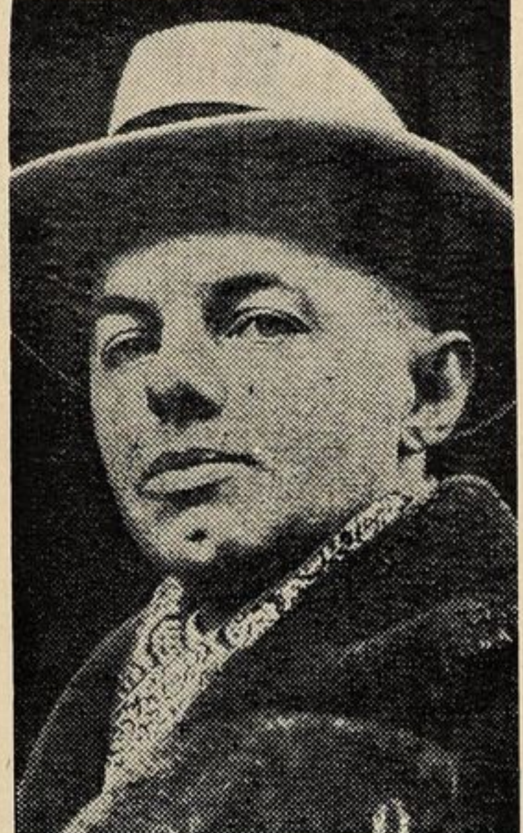
Mitchell Frederick Hepburn

Primo Ministro dell'Ontario, Presidente del Concilio e Tesoriere Provinciale.