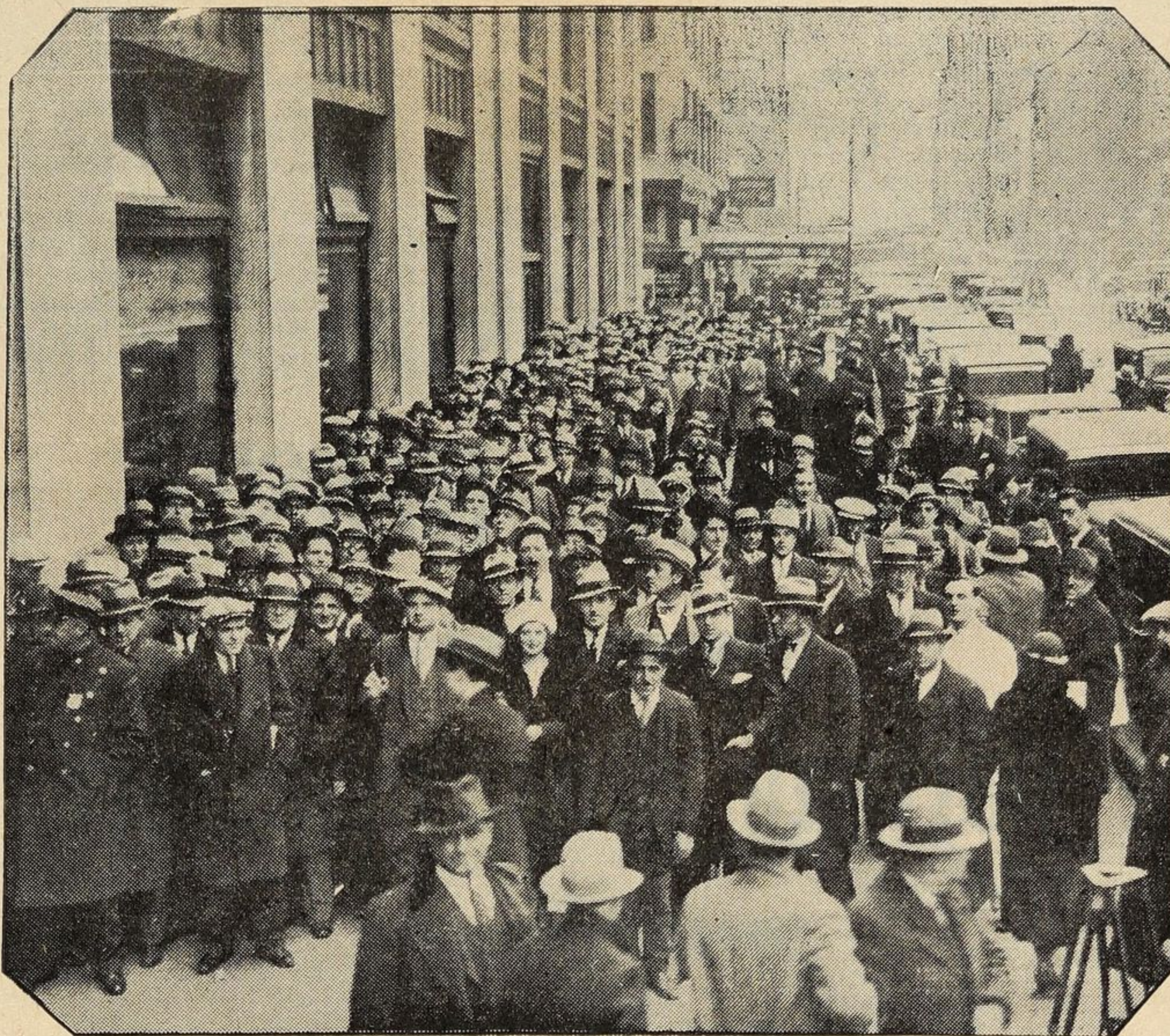
Una folla immensa sollecita all'ufficio d'igiene di New York il permesso di vendita della birra.

teressi dei cittadini, sia curando che vengano osservate le leggi e i regolamenti, sia sorvegliando il funzionamento di tutti i servizi postali.