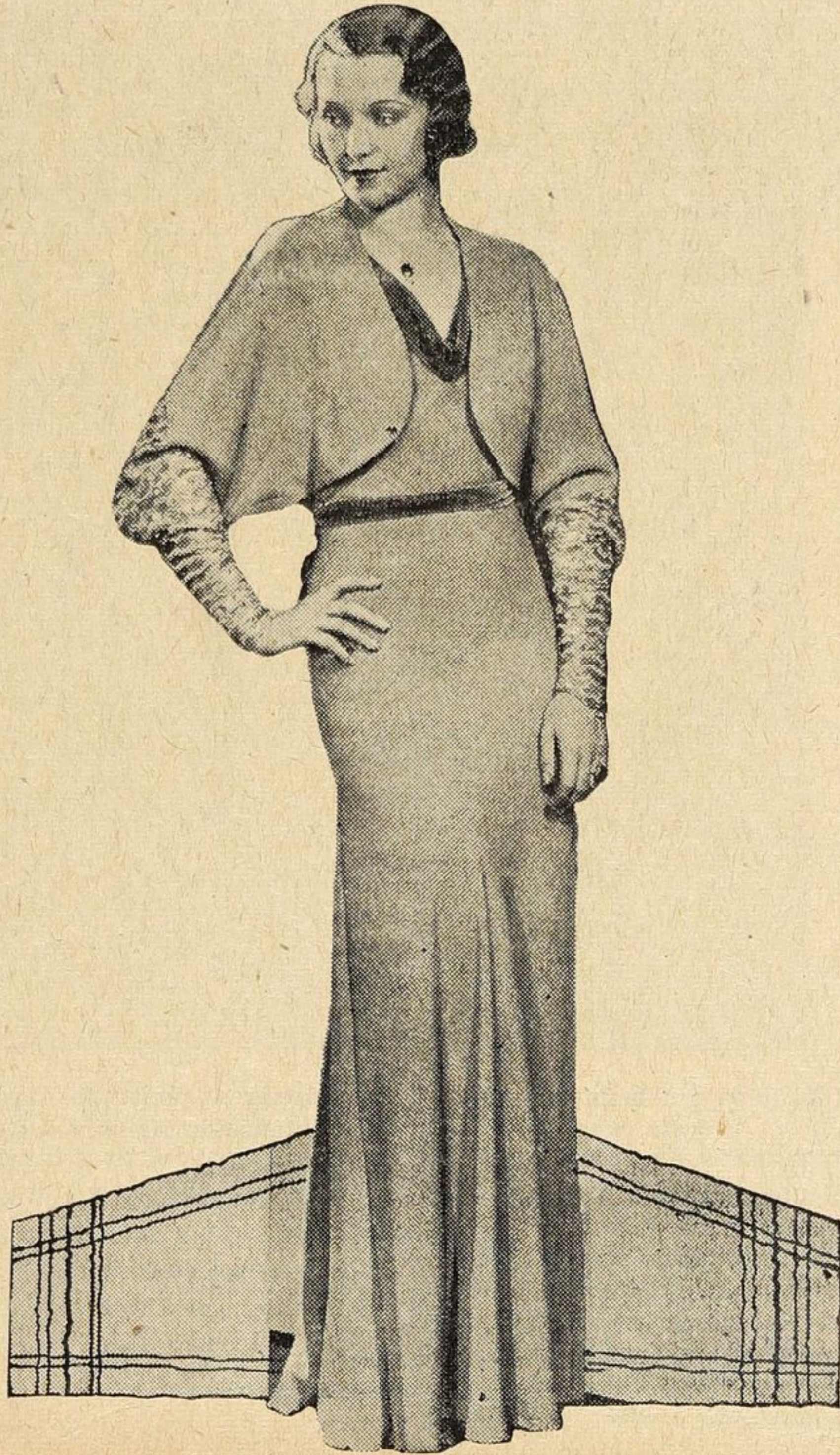
Abito grigio con maniche di tela d'argento.