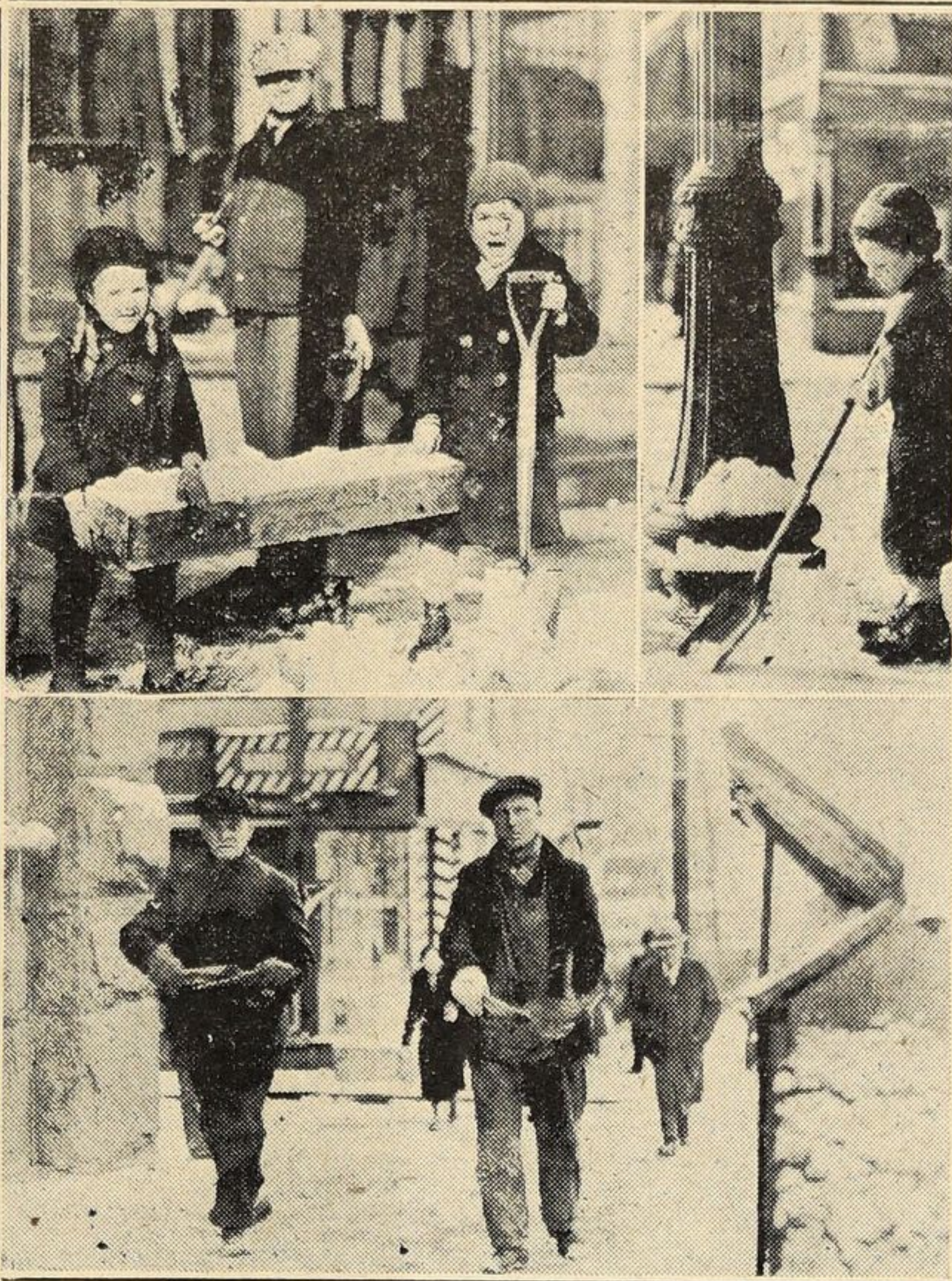
Per i grandi e per i piccoli la neve è fonte di gioia. I piccoli vi trovano i divertimenti della loro età e i grandi vi trovano lavoro e pane.