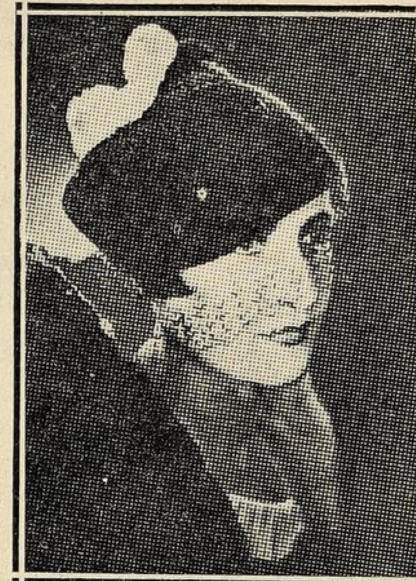
Cappello di velluto nero sormontato da un nodo di ermellino.