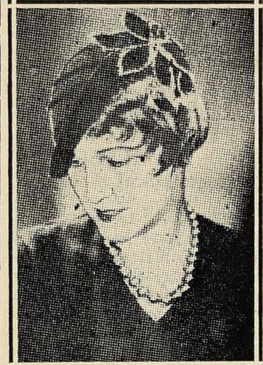
Delizioso cappellino di velluto nero, creazione di Agués.

Si rifiatava noi? si pensava? Li eravamo: inchiodati. Diceva: «Guardatevi, guardatevi bene. Radunati, siete un magnifico plotone umano: centoventi cuori, più il mio, che battono sugli egoismi, arrivare in porto. Semplici, grandi verità; ripetevicini. Rimane l'odio; ma io non ci credo all'odio vostro. Non potete odiarmi. Mai lo potrete. Vi basterebbe stringervi, serrare il plotone per ischiacciarmi. Fate-lo».