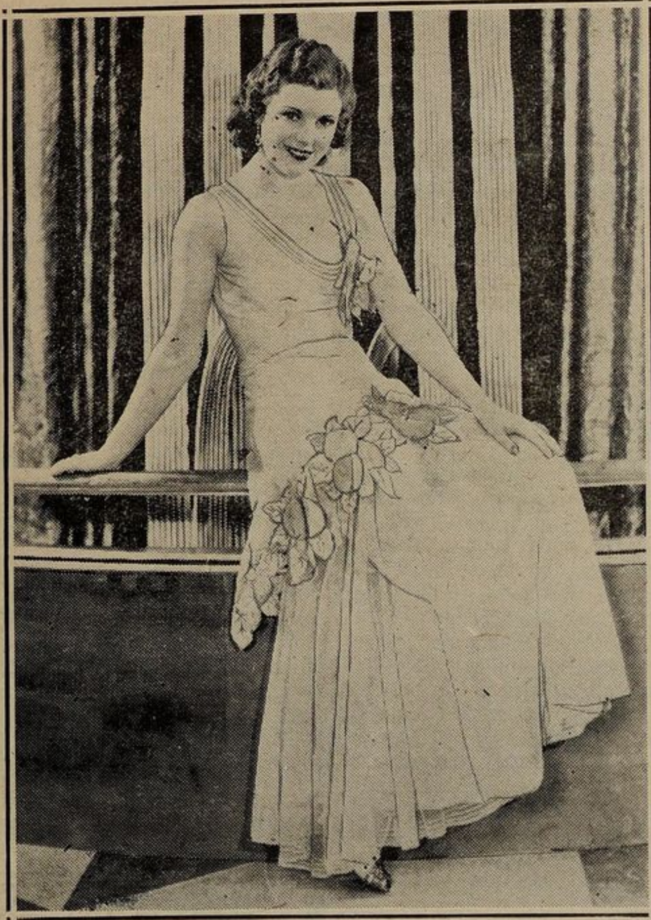
Abito di taffeta bianco interamente coperto da tulle e arricchito da ornamenti di taffeta rosa e verde.