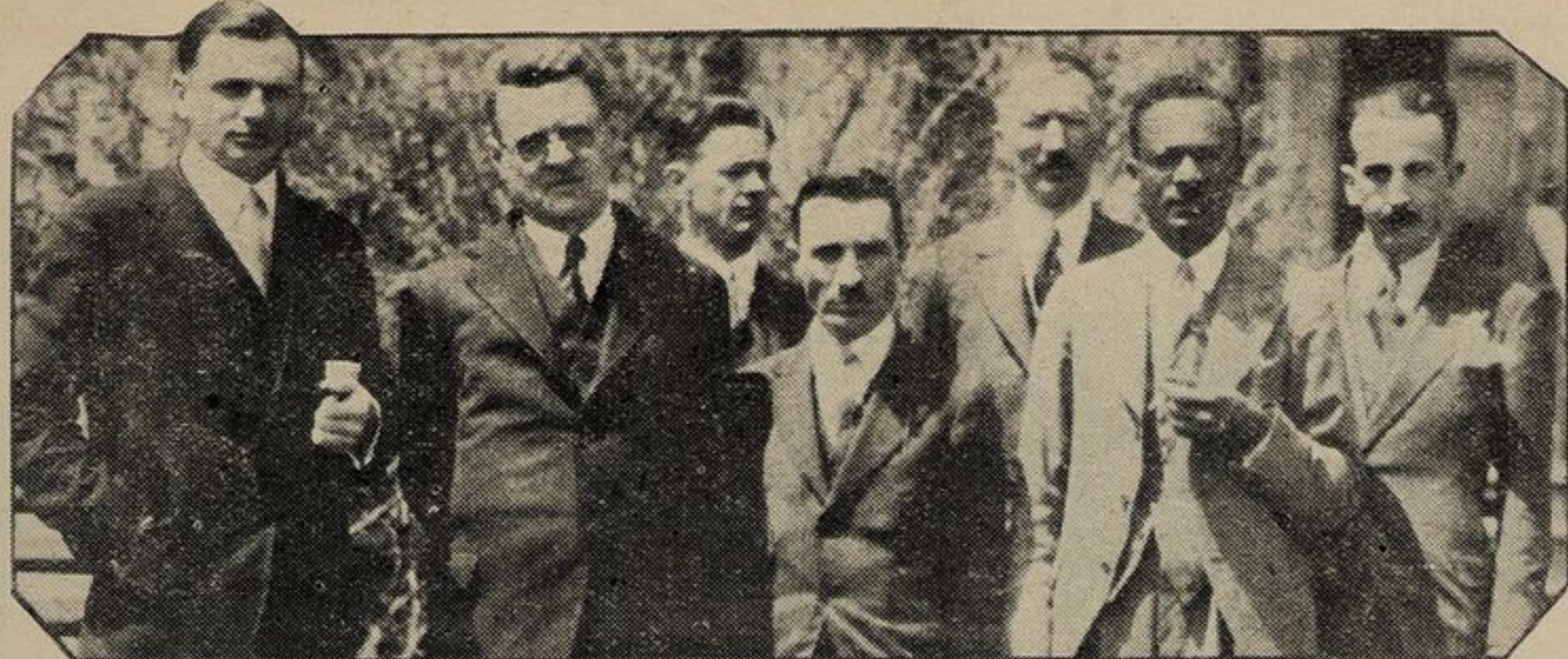
Una riunione dei membri della società di protezione delle piante.