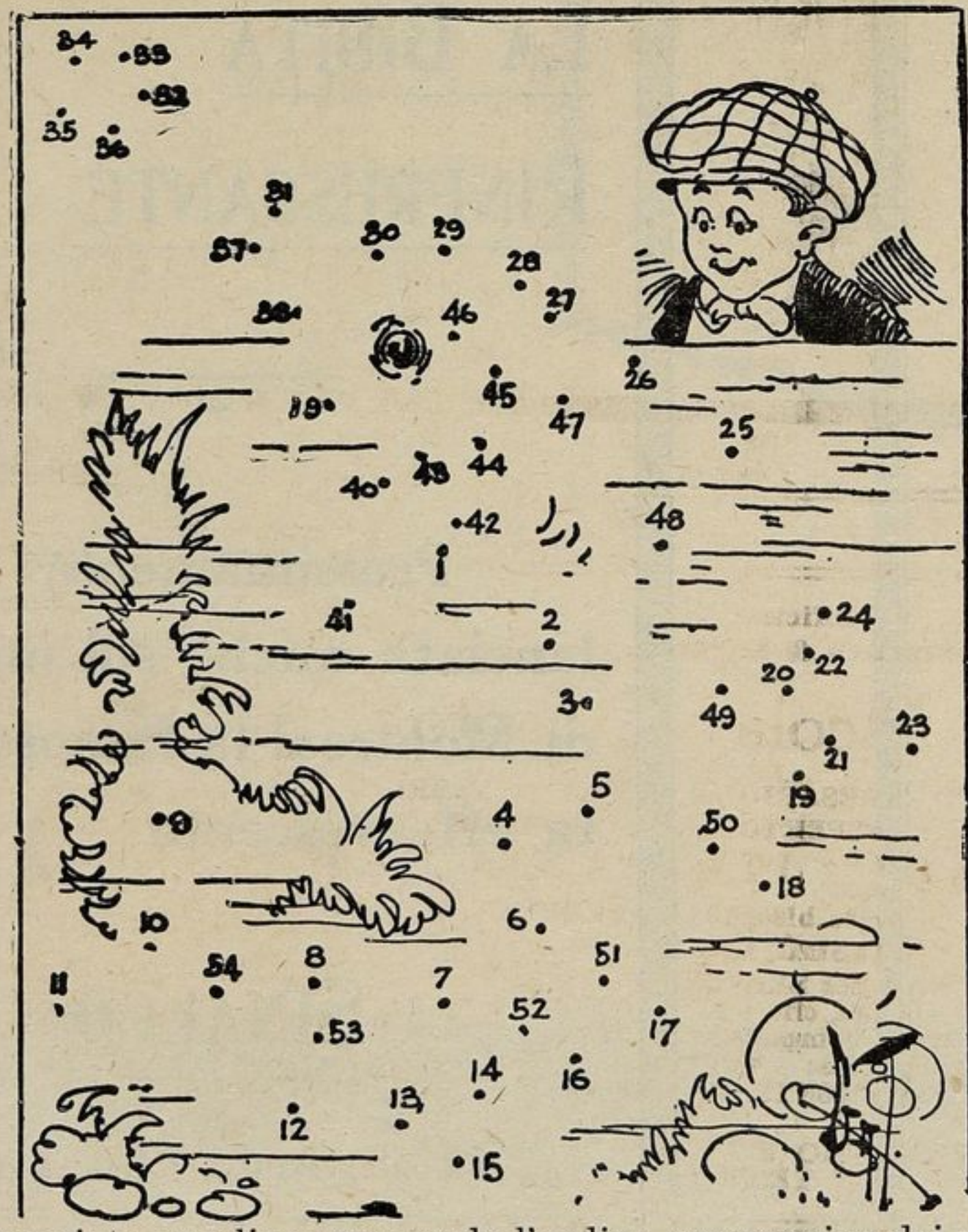
Tracciate una linea seguendo l'ordine progressivo dei numeri della vignetta ed avrete un bel disegno.