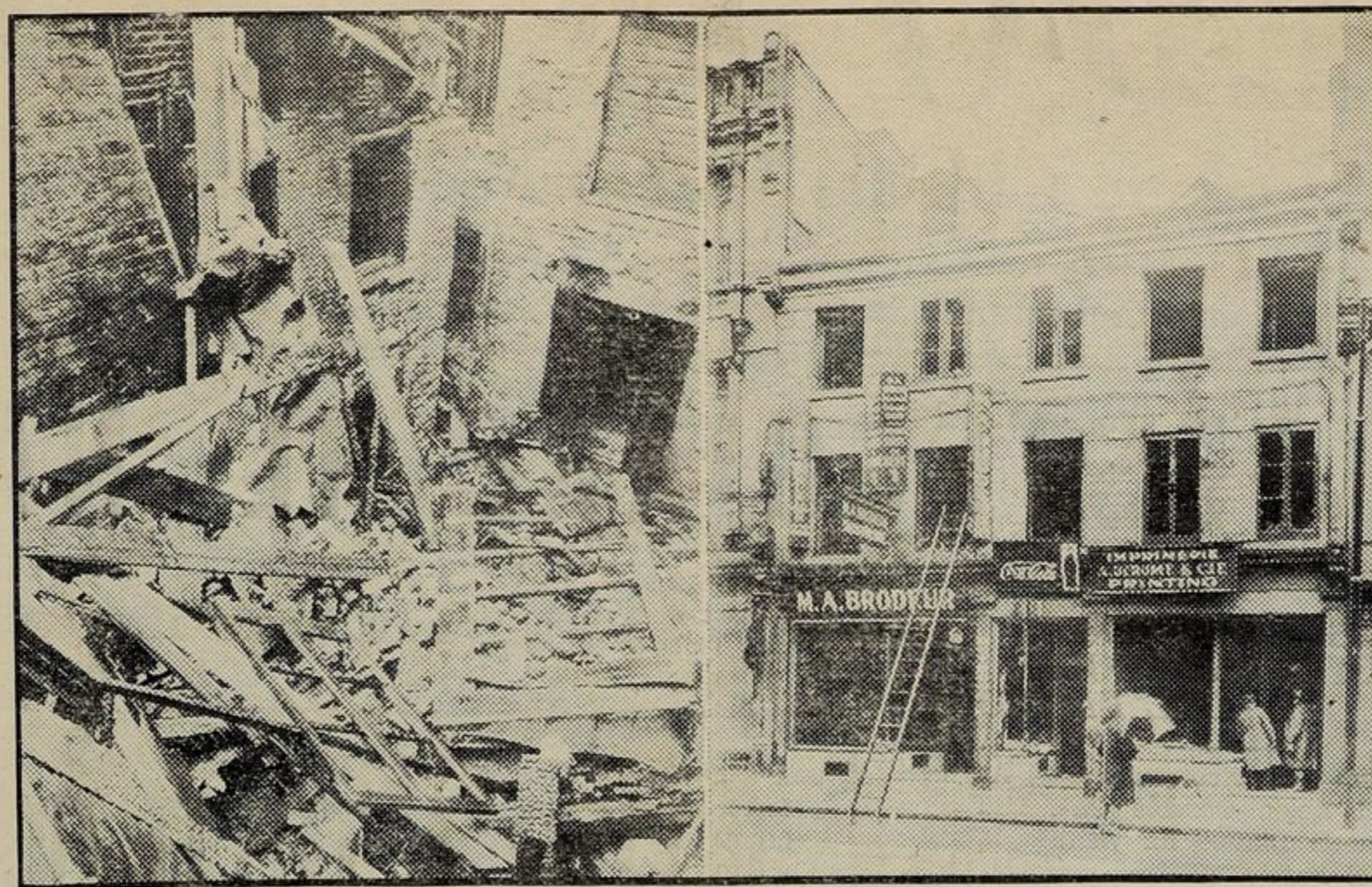
Le fotografie mostrano i luoghi dell'incendio che ha causato più di $100.000 di danni sulla strada Notre Dame, vicino Saint Jean Baptiste martedì mattina.

In questi focolari di scienza in cui passano a frotte le nuove ge- nerazioni palestinesi viene inse- conoscere il vero volto dell'Italia moderna.