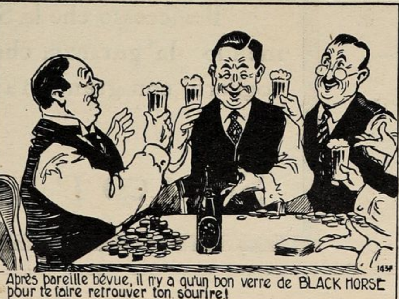
Après pareille bevve, il n'y a qu'un bon verre de BLACK HORSE pour te faire retrouver ton sourire!

dites simplement— "Bière Black Horse Dawes s.v.p."