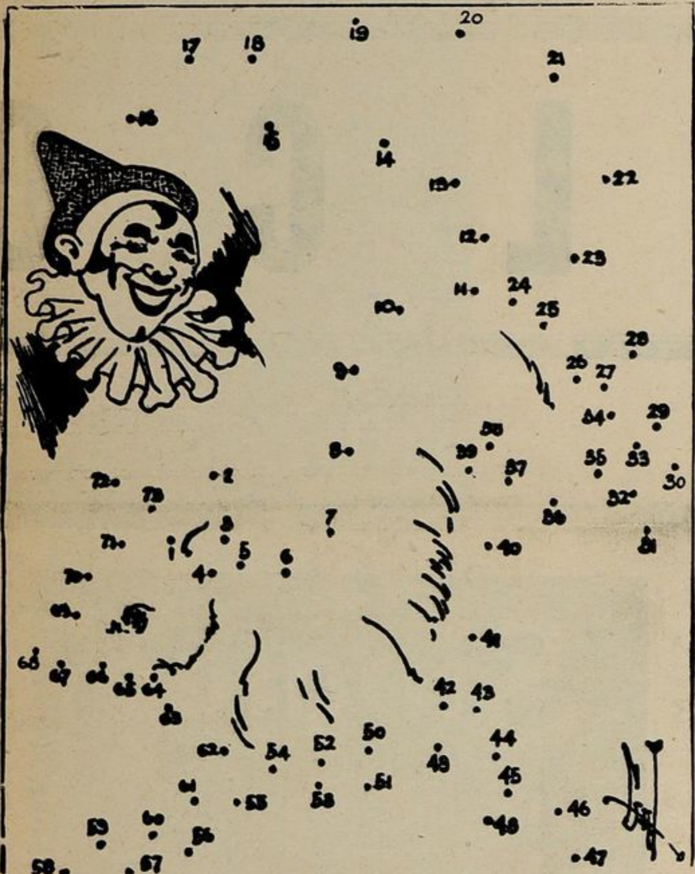
Tracciate una linea seguendo l'ordine progressivo dei numeri della vignetta ed avrete un bel disegno.

STATUE ARTISTICHE E RELIGIOSE, LIBRI, ROMANZI, ECC., ECC.