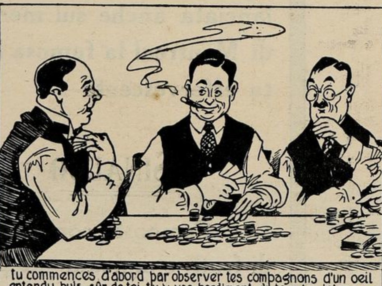
tu commences d'abord par observer tes compagnons d'un oeil entendu puis, sûr de toi, tu vas hardiment de tous tes jetons.