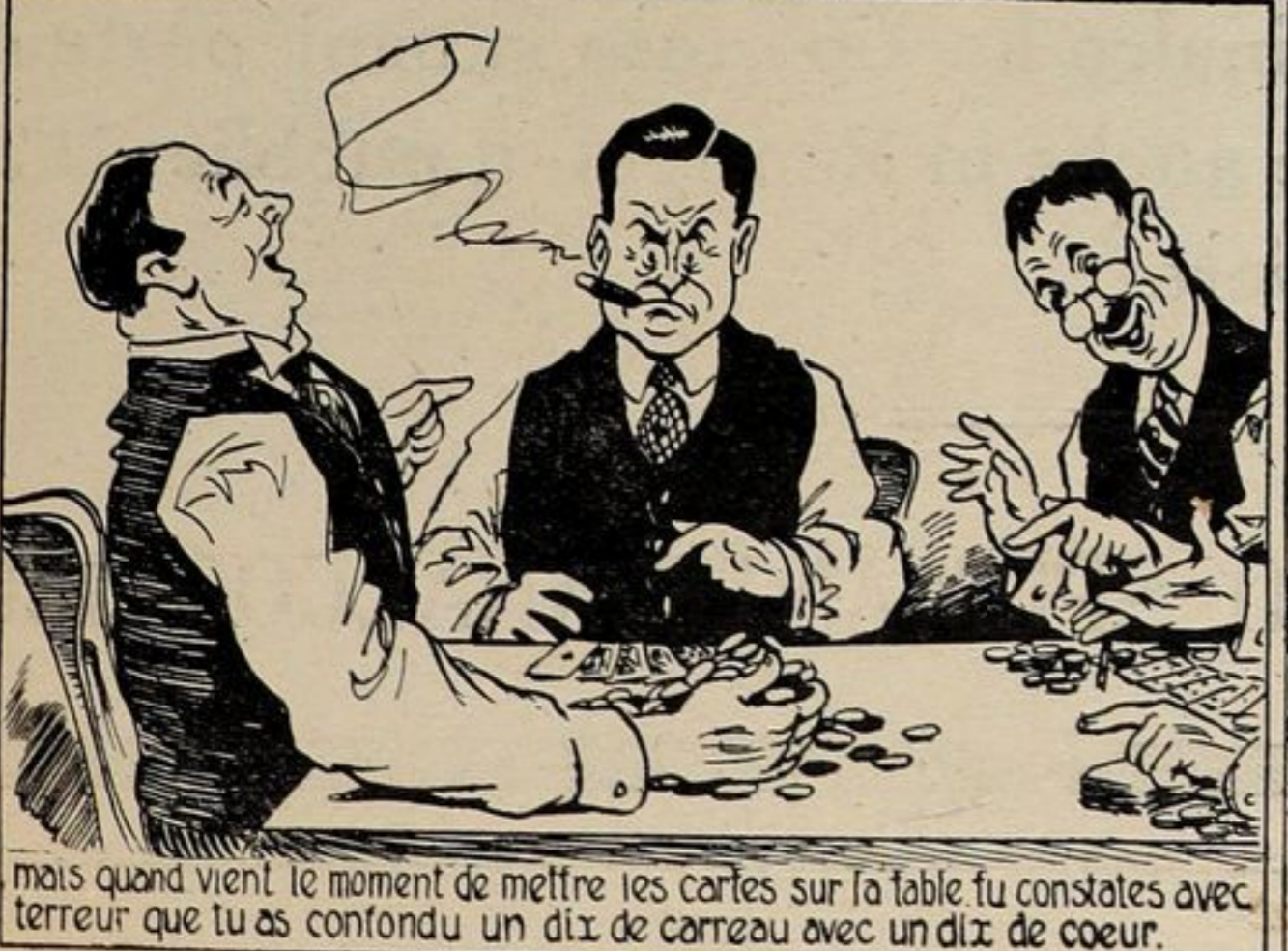
mais quand vient le moment de mettre les cartes sur la table tu constates avec terreur que tu as confondu un dix de carreau avec un dix de cœur.