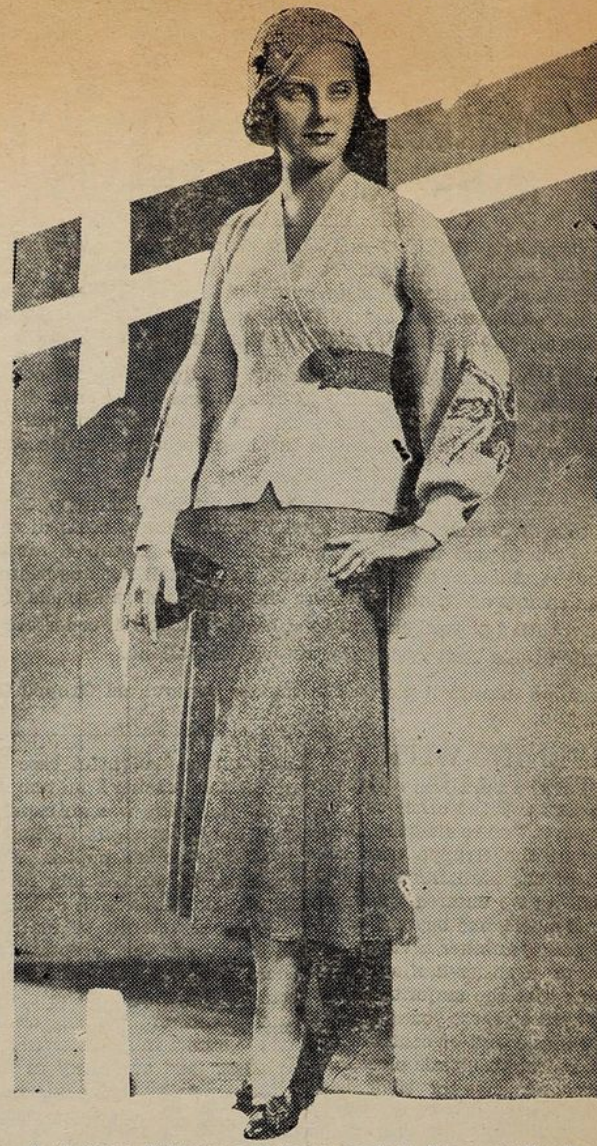
Questo insieme di bruno e di beige rende la figura molto elegante.