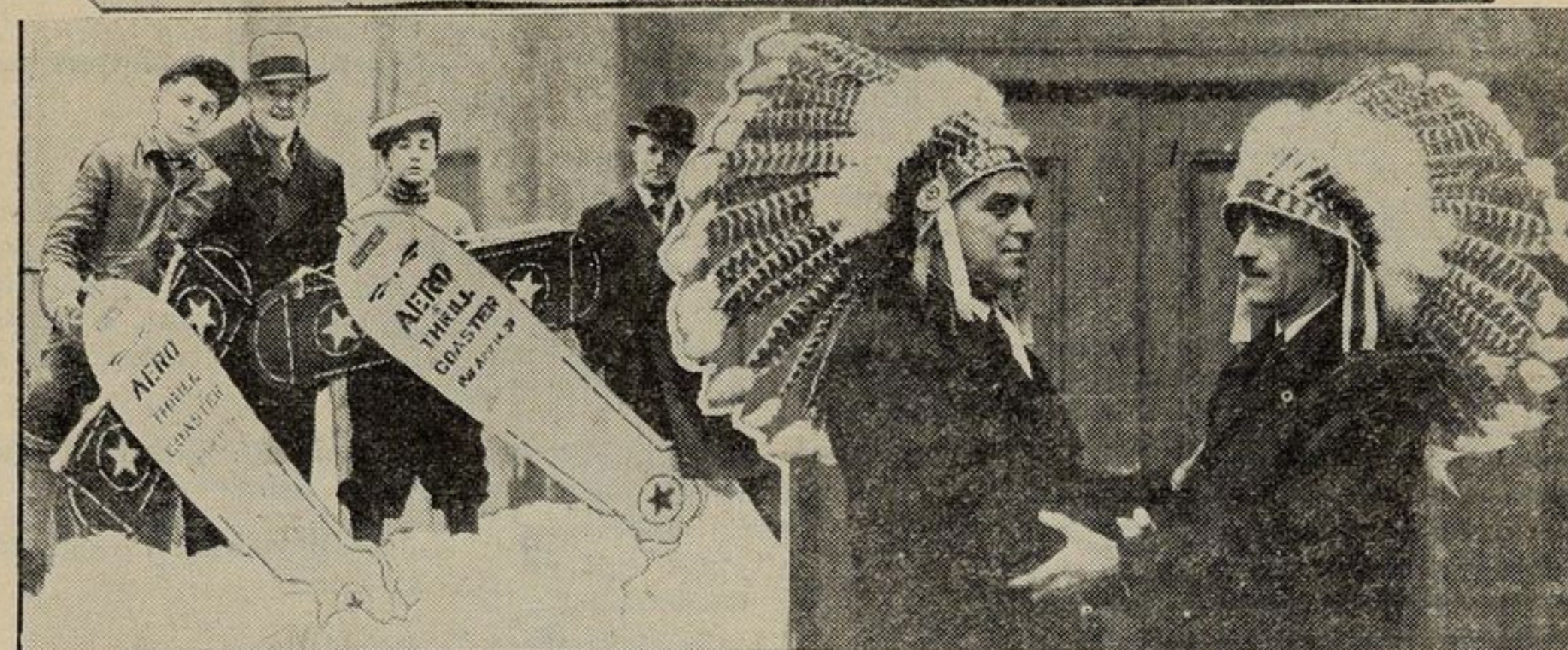
Sabato scorso più di 7000 giovanetti e giovanette hanno preso parte ad una festa organizzata dal "Canada Dry Ginger Ale".