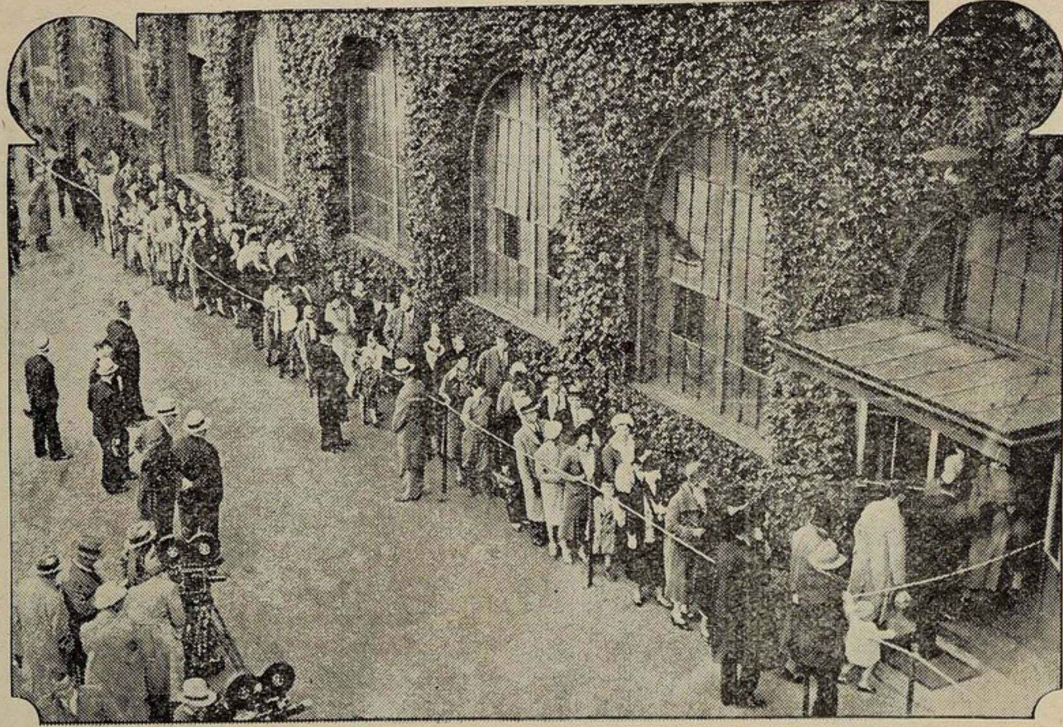
Ecco una folla immensa che devotamente visita la salma.