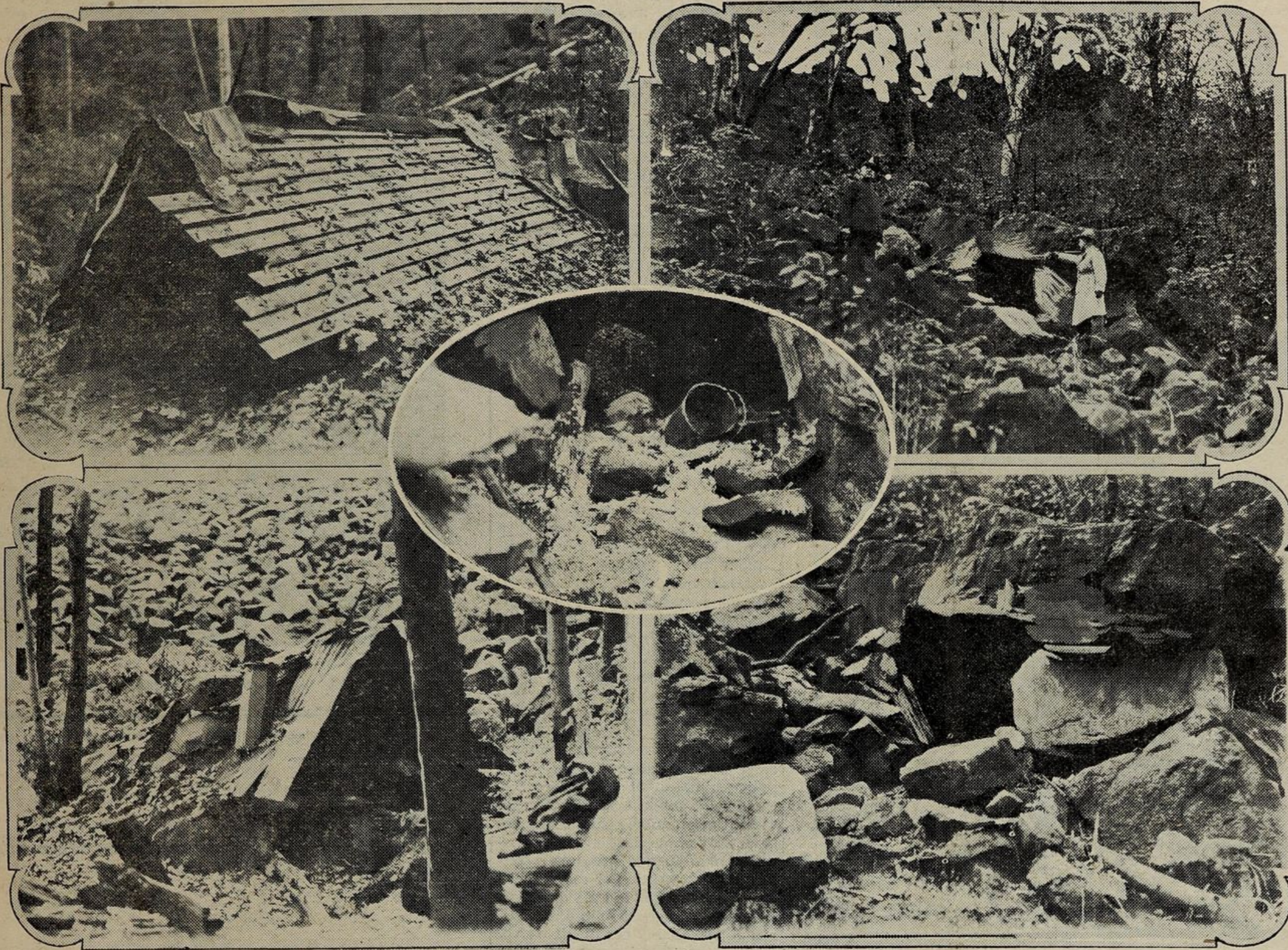
Pochi uomini hanno pensato di vivere in montagna. Però la polizia li ha cacciati.