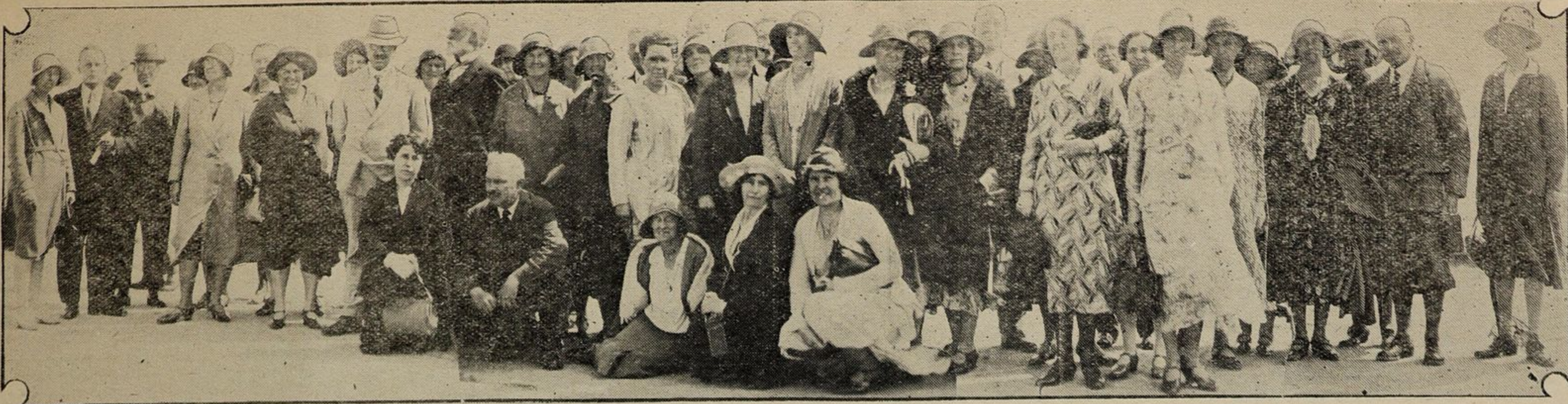
Un gruppo di sessantacinque istitutori e istitutrici d'Inghilterra hanno terminato il loro viaggio attraverso l'Ovest del Canada, dove hanno grandemente ammirato le scuole del Paese "costruite dovunque, essi dicono, corrispondentemente alla pedagogia e all'igiene".