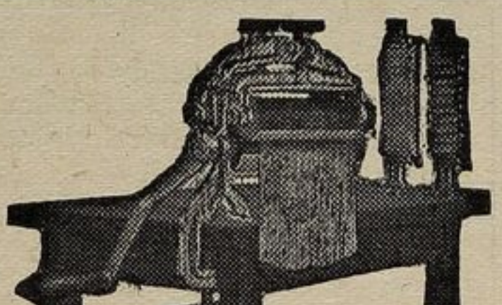
LA PERFETTA $12.00