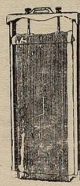
CHITARRA per Maccheroni $2.75

Baccellieri Bros. Mfg. Co. 924-26 So. 11th Street Philadelphia, Pa.