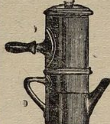
CAFFETTIERA alla Napoletana da $1.00 a $5.00

Saremo lieti a rimborsare il denaro a qualsiasi persona che non è soddisfatta della nostra merce