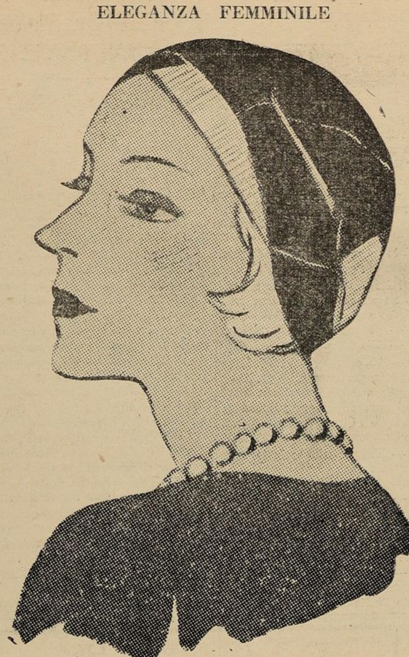
Questo piccolo "beret" di paglia marrone guarnito con un nastro di paglia beige, è di una semplicità e fine eleganza