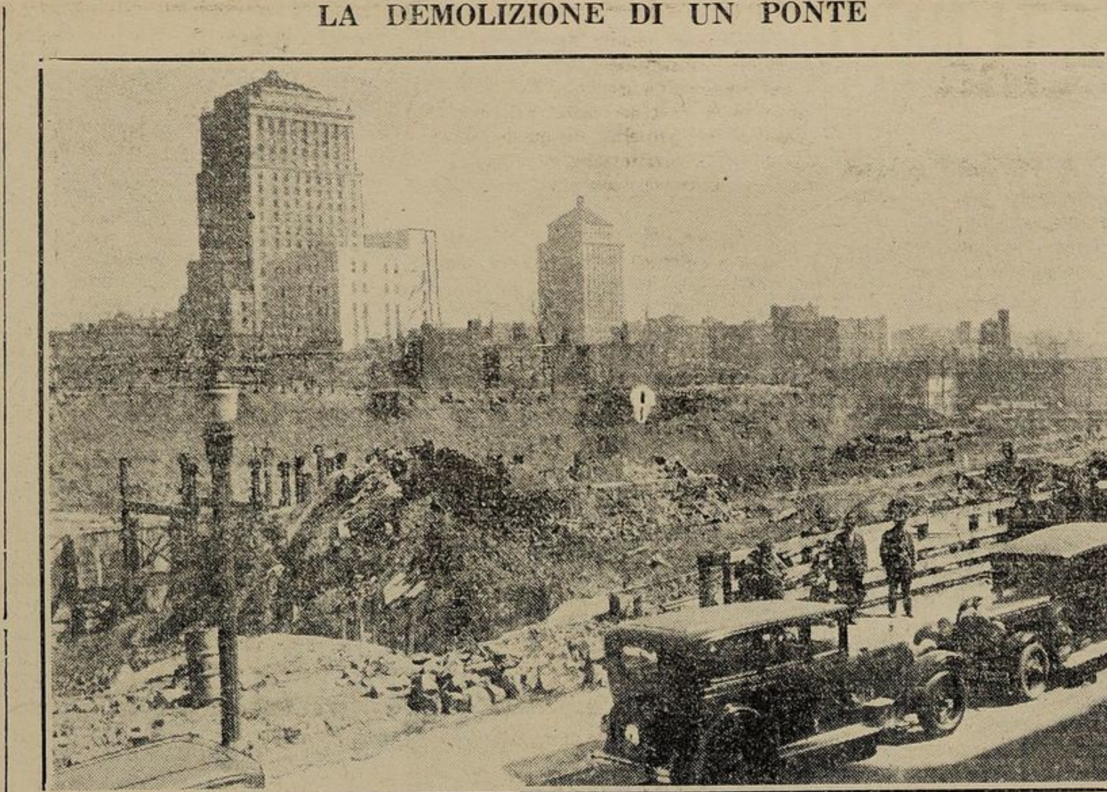
I lavori per la costruzione della stazione centrale del Canadian National si avanzano pure rapidamente, ed il ponte sulla strada Dorchester vicino Mansfield è ora completamente demolito. La vignetta mostra l'aspetto della strada Dorchester.

Vogliamo intanto ricordare che si avvicina la data del Tag-Day, l'annuale colletta pubblica per i nostri orfani, che avrà luogo il 6 giugno prossimo. Il concorso delle signore e delle signorine italiane (escluse le bambine) per il Tag-Day si rende indispensabile se si vogliono avere risultati tangibili e portare un serio contributo alla vita dell'Orfanotrofio. Si raccomanda pertanto alle donne italiane di prenotarsi presso la direzione della pia istituzione, al più presto, onde prestare in quel giorno la loro opera ed ottenere il massimo rendimento. Si tratta della vita dei nostri orfani e di fronte a quest'opera umanitaria ogni sacrificio deve sembrar lieve.