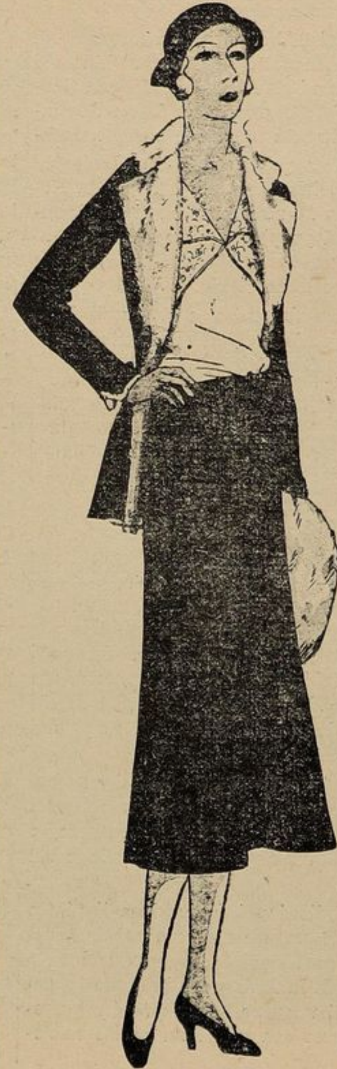
Elegante abito invernale, per il passeggio.