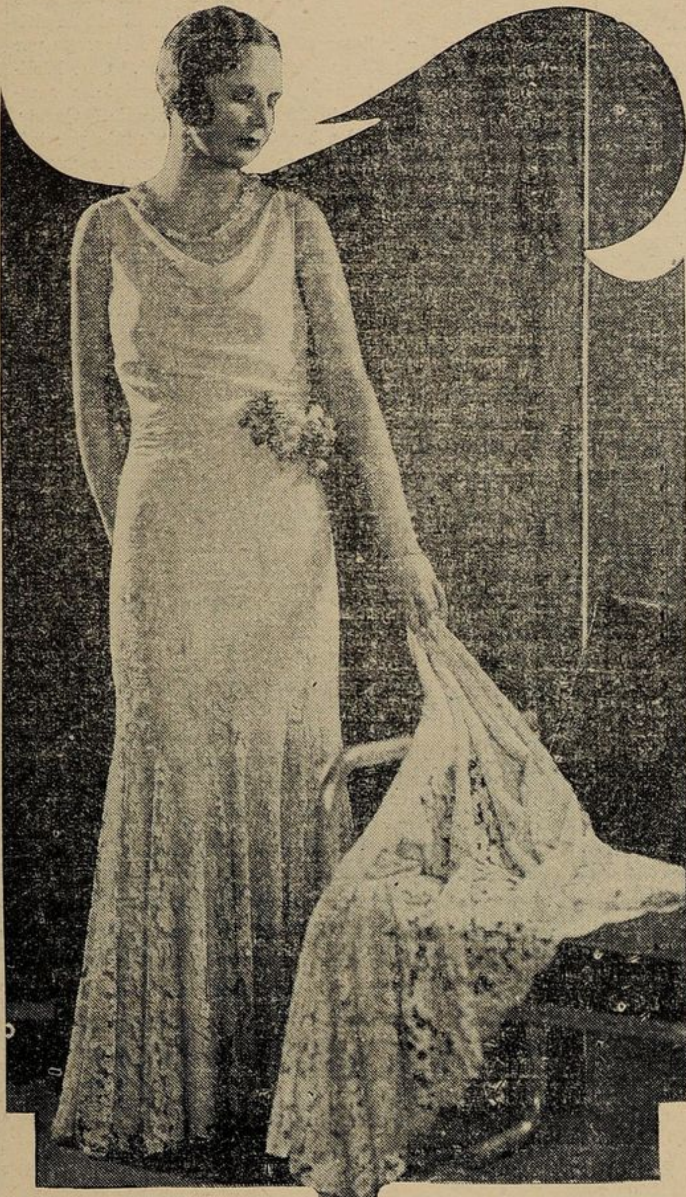
Bellissimo "ensemble" per sera, di crepe di seta e merletto con scollatura leggermente crespa.