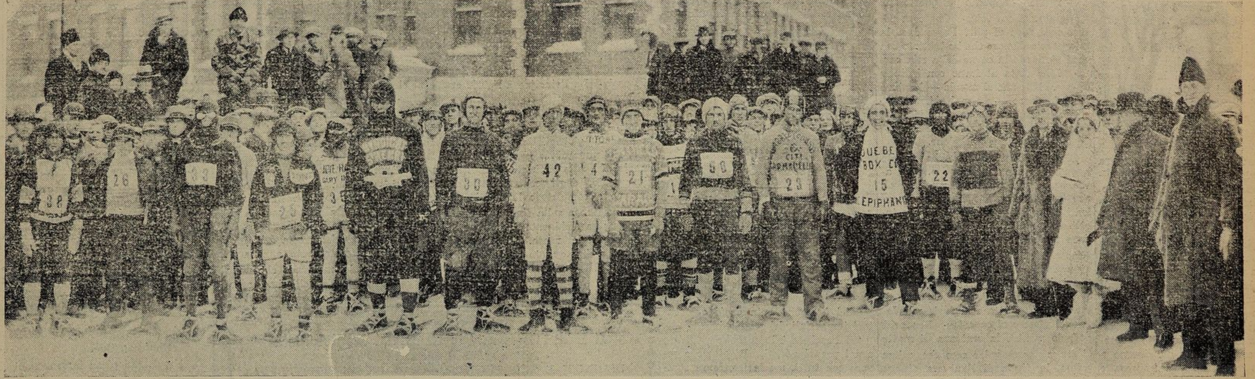
Interessante gruppo di concorrenti nella maratona di 200 miglia in "raquettes" da Quebec a Montreal. La fotografia è stata presa pochi minuti prima della partenza.

vestito la crepe marocain nero o colorato, la cui sottana termina a due centimetri da terra e viene stretta alla vita da una cintura che serve a renderla corta quanto si vuole, rialzando il corpetto. Questo è scollatissimo e senza maniche, cosicché allargando la cintura, la gonna si allunga e si rimane in abito da sera. Sopra questa, per il pomeriggio, quando la gonna è corta, si pone una morbida giacca dello stesso tessuto dell'abito. La forma è semplice, molto aderente e termina alla vita dove viene fissata da una semplice fibbia.