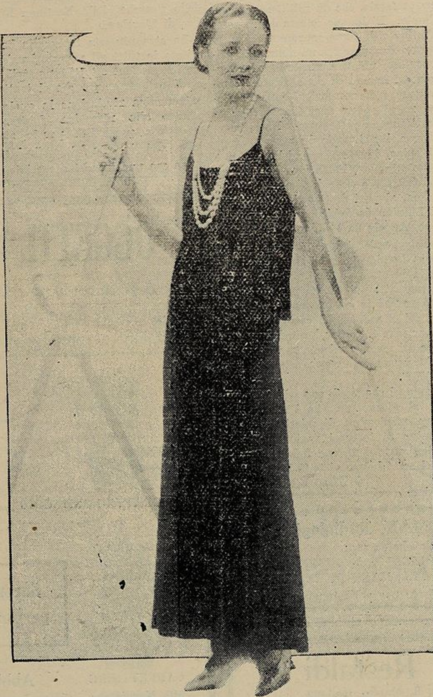
La moda del bianco è oggi in onore. Questo delicato vestito di mussolina di seta bianca è guarnito semplicemente di due nodi dello stesso tessuto.