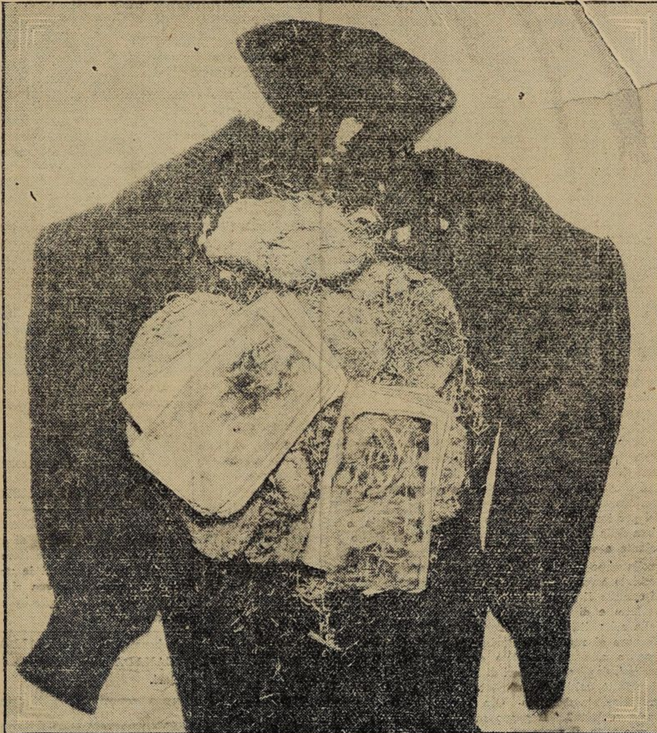
Il taccuino dell'esploratore Andree, perito nel 1897, dopo una avventurosa spedizione nelle regioni polari artiche, rimasta fino a pochi mesi or sono avvolta nel più fitto mistero. Il taccuino ritrovato da alcuni cacciatori norvegesi ha svelato i particolari della tragica avventura.