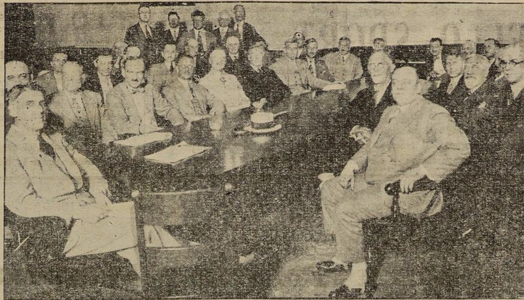
Un gruppo di finanziari e rappresentanti delle grandi compagnie di utilità pubblica riuniti al Palazzo Municipale, sotto la presidenza del Sindaco, On. Camillien Houde, per discutere i mezzi più atti a risolvere il problema dell'alto costo delle espropriazioni a Montreal.

verso gli oceani e per tutti i continenti?