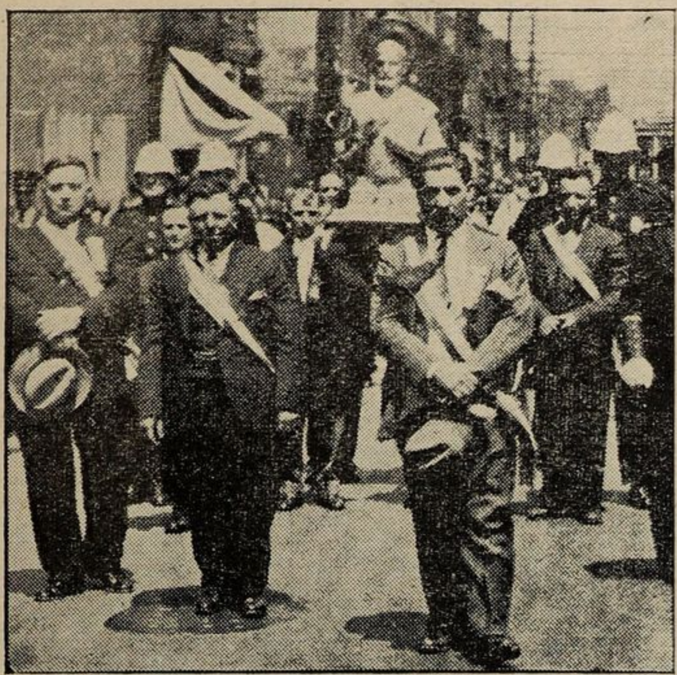
Gruppo d'Italiani della società di M. S. Gugliesana, partecipanti alla processione del loro patrono Sant'Adamo, lungo le strade della parrocchia di San Giuseppe.