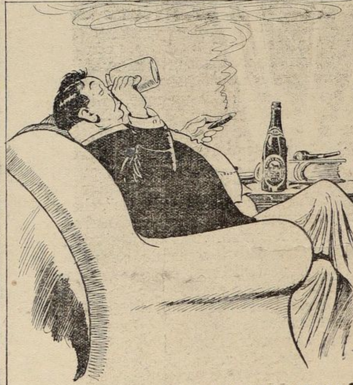
T'AS-PAS ALORS ESSAYÉ UNE BLACK HORSE? TU GAGNES À CHAQUE FOIS. 82F