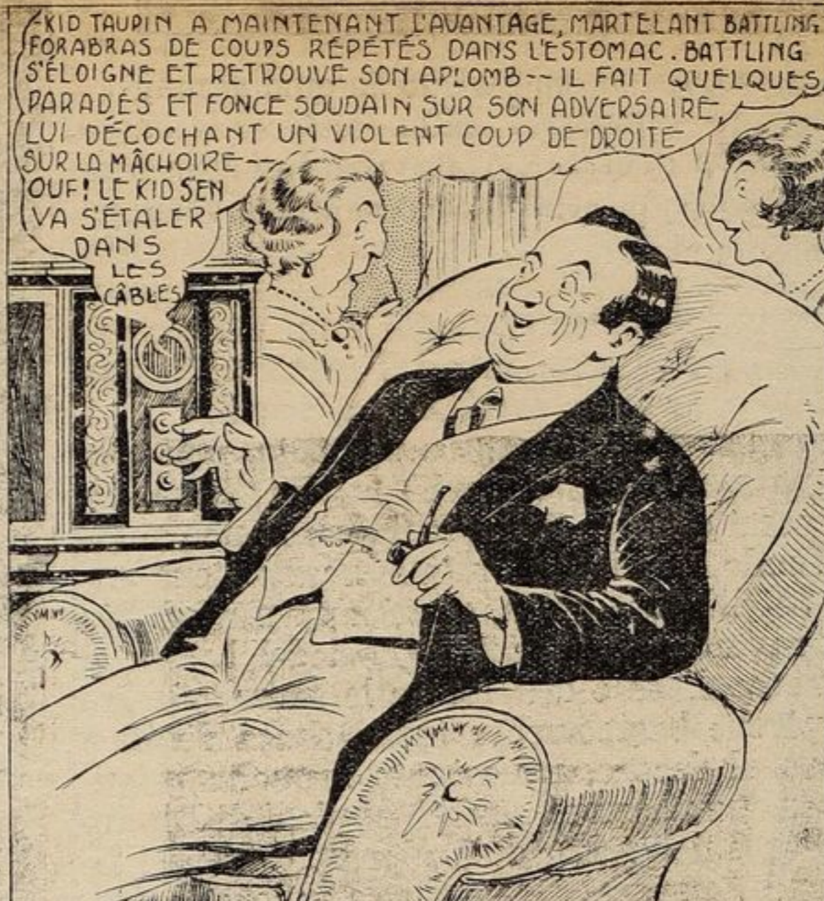
MAIS JUSTE AU MOMENT OÙ ÇA COMMENCE À DEVENIR INTÉRESSANT—