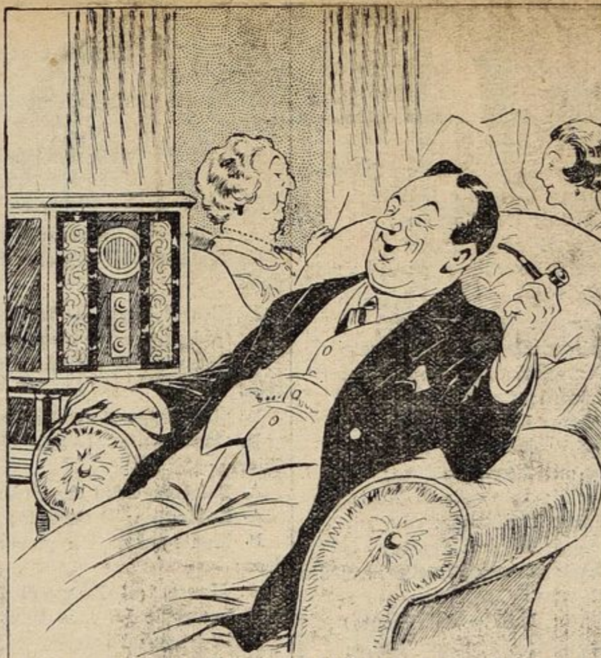
T'AS-PAS DÉJÀ DÉCIDÉ, PLUTÔT QUE DE DÉPENSER $3.50 POUR ASSISER À LA BOXE, DE T'INSTALLER COMFORTABLEMENT CHEZ TOI POUR ÉCOUTER LE RAPPORT DU COMBAT AU RADIO—