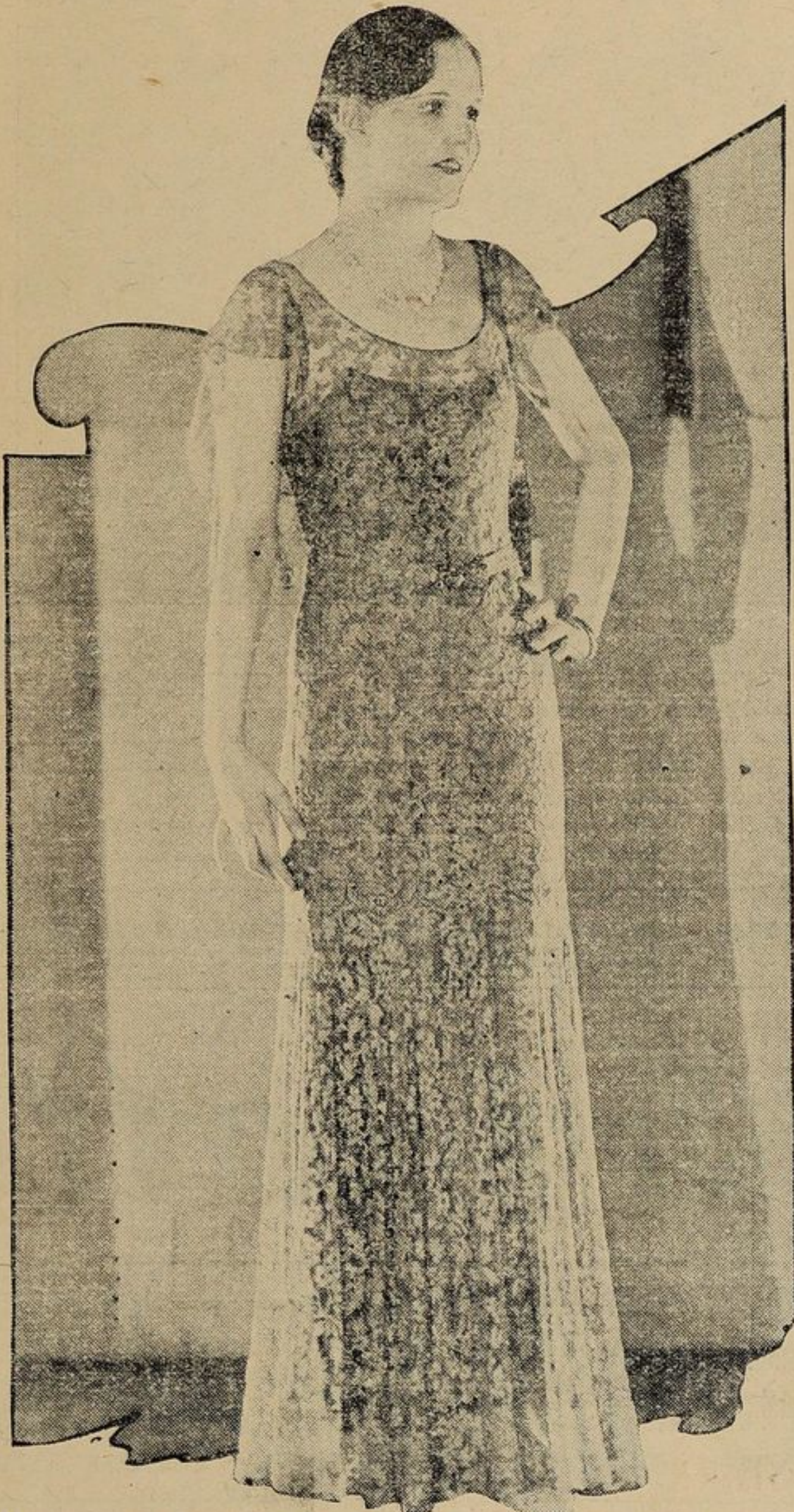
Il ricamo e le trine applicati all'abbigliamento femminile sono molto in voga come rivela questo elegantissimo modello.