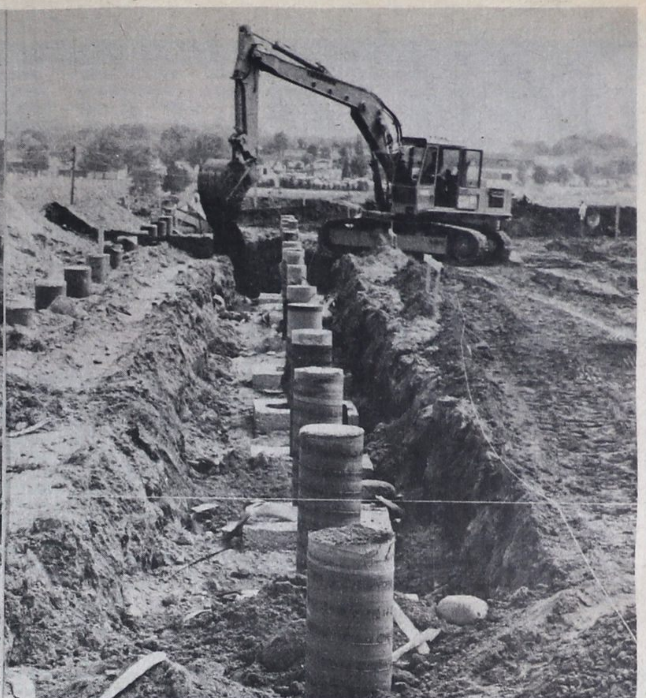
forms could be cut. Eldale Structures is committed to having a demountable school on the site

Forms into which cement was being poured Monday at the Ecole Secondaire Le Caron construction site were being filled as quickly as the