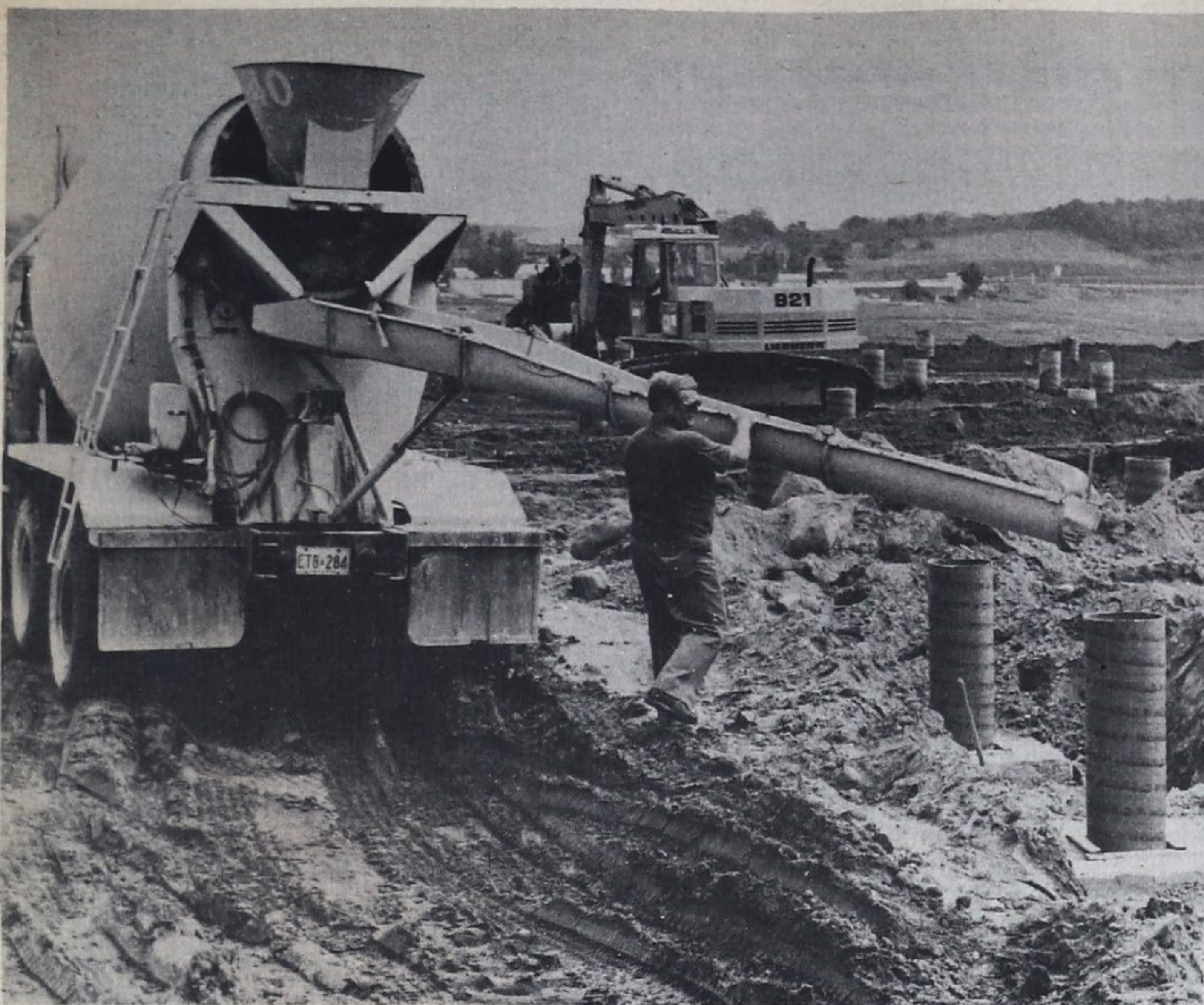
Forms filled fast

Forms into which cement was being poured Monday at the Ecole Secondaire Le Caron construction site were being filled as quickly as the