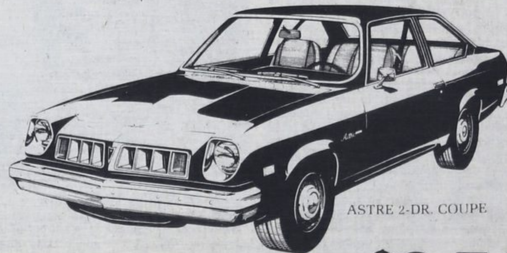
ASTRE 2-DR. COUPE

2 barrel carb., 140 cu. in., auto. transmission, radio, electric rear defrost, perf. axle, Serial no. 2C11B6U517980