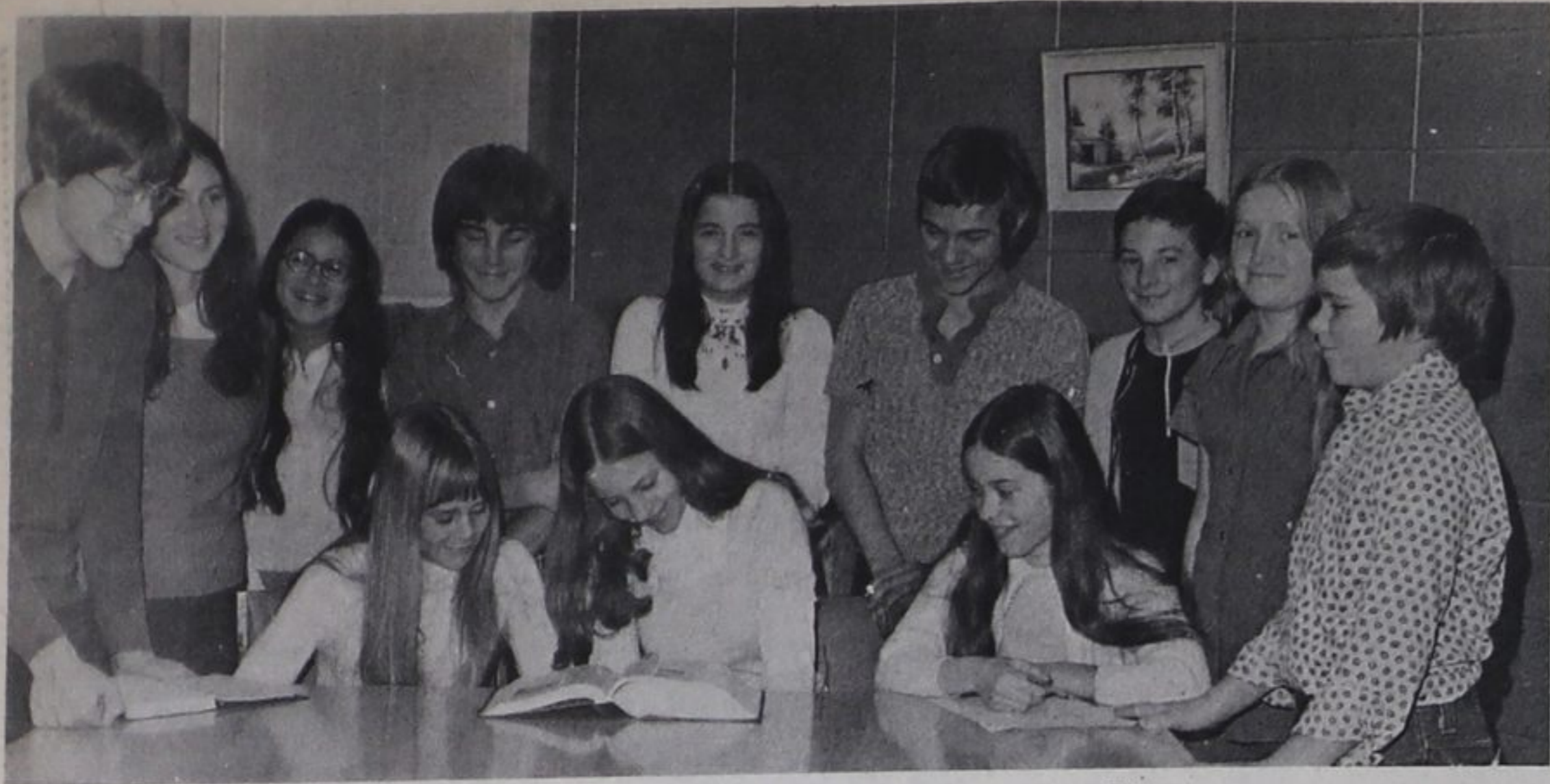
Sainte-Croix student council