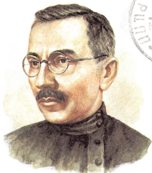
Советский педагог и писатель А. С. МАКАРЕНКО • 1888 — 1939