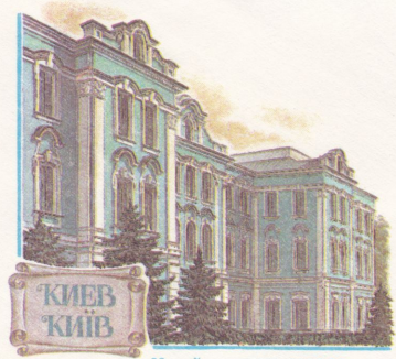
Музей истории города Музей истории міста

Куда Київ-601-мст бульвар Лесі Українки, 20