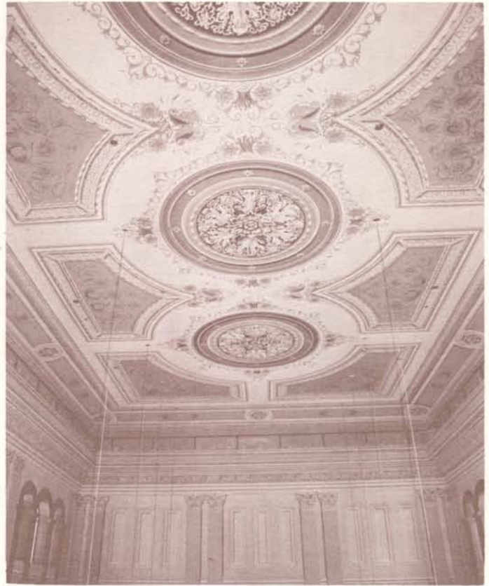
Ceiling of Concert Hall. Le Plafond de la Salle de Concert.

This pamphlet prepared by the Victoria Hall Volunteers, 1993.