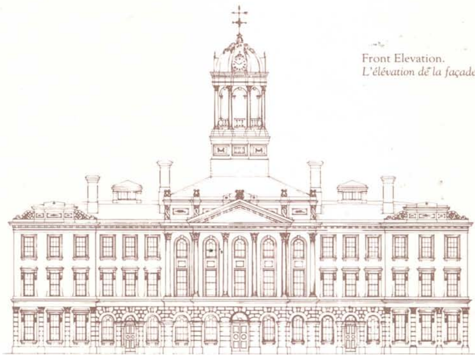
Front Elevation. L'élévation de la façade.