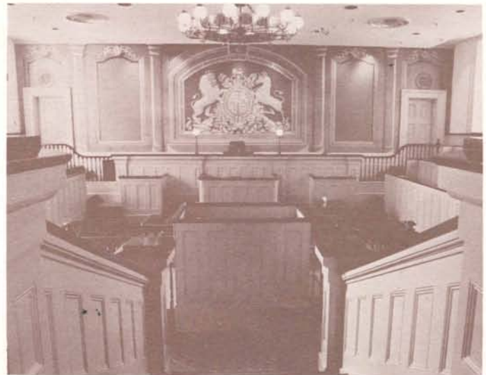
Courtroom La Cour de Justice